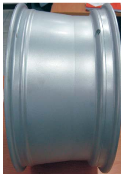
產品側面實體相片

更感謝委員們於期中稽核時，針對產品開發中的困難處加以指導，讓開發所需時程可以更縮短並如期達到新產品的開發。