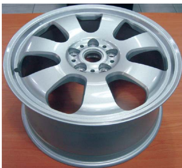
產品正面實體相片

本新產品汽車用鎂合金鍛造輪圈不僅可得到鎂合金材料特性，其比重為 1.74 g/cm 3 ，約為鋁之 2/3、鋼之 1/5 及在金相組織上擁有細晶粒的特質；更在鍛造及旋型等製程的加工運用下，產出高強度、高密度、高輕量化等特性的輪圈，於使用上符合節能、環保的趨勢。